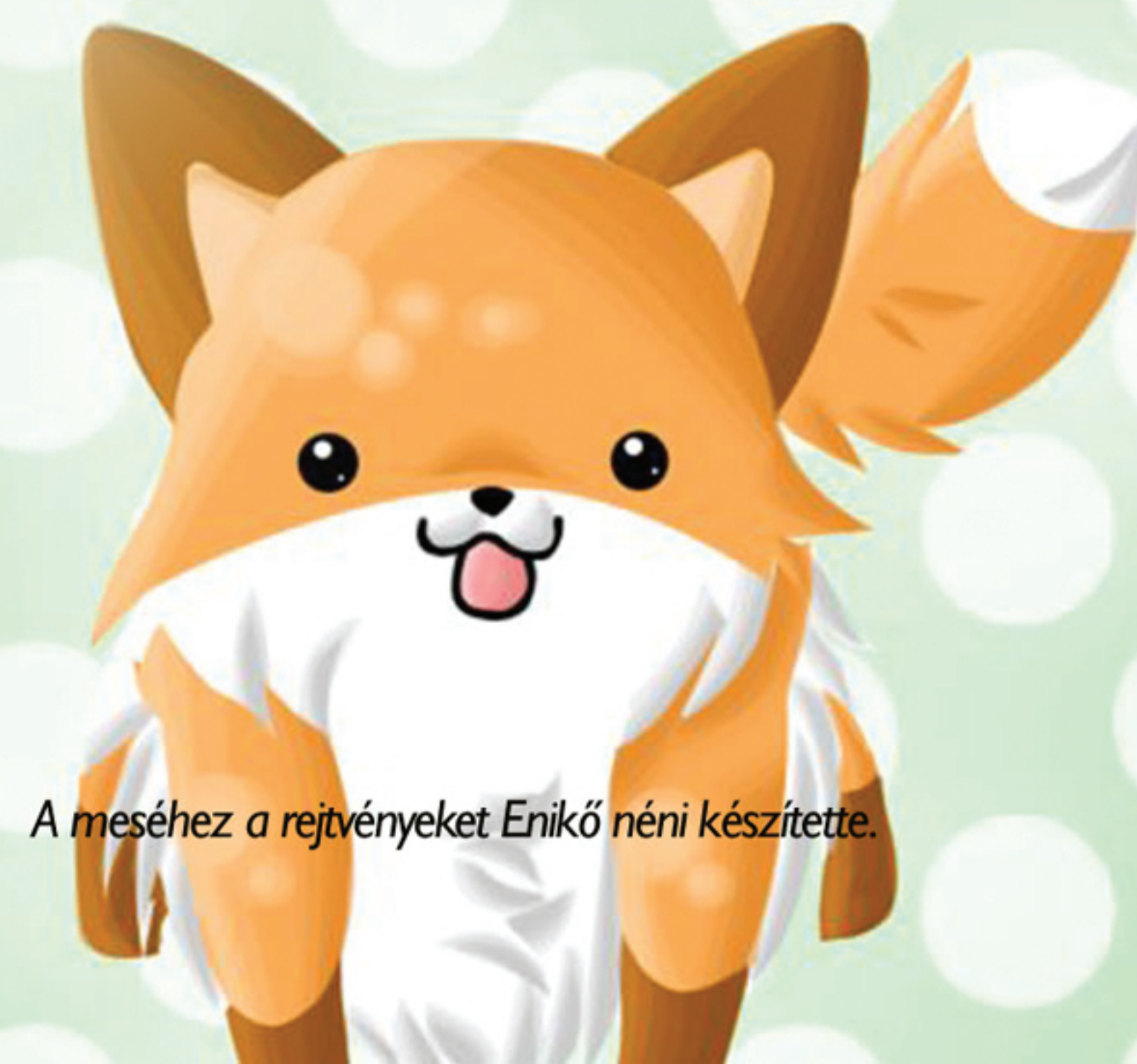
A meséhez a rejtvényeket Enikő néni készítette.